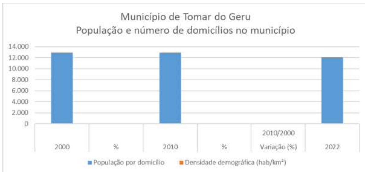
Município de Tomar do Geru Quadro 03 - Comunidades cadastradas no município

Quanto à densidade demográfica, em 2022, o município registrou 39,40 habitantes por quilômetro quadrado. Em comparação, a densidade era de 42,11 habitantes por quilômetro quadrado em 2000 e subiu ligeiramente para 42,16 em 2010. Entre 2000 e 2022, a densidade demográfica apresentou uma diminuição de cerca de 6,44%, conforme ilustrado no Quadro 02.